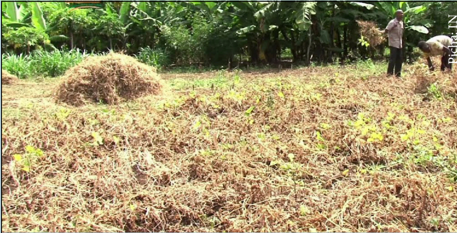
Ni muhimu kwa mkulima kuhakikisha anavuna maharage kwa wakati kuepuka upotevu

Maharagwe ni zao muhimu la m-kunde ambalo ni chanzo kikubwa cha protini na hulimwa kwa asilimia kubwa na watanania na jamii nyingine za mashariki mwa Afrika.