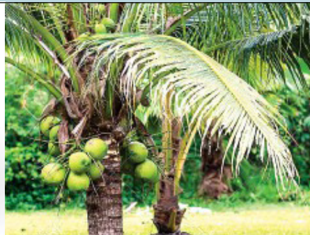
Nazi bora zilizozalishwa wa kufuata kanuni sahihi za kilimo cha minazi

Mkulima Mbunifu ni jarida huru kwa jamii ya wakulima Afrika Mashariki. Jarida hili linaneza habari za kilimo hai na kuhusu majadiliano katika nyanja zote za kilimo endelevu. Jarida hili linatayarishwa kila mwezi na Mkulima Mbunifu , Arusha, ni moja wapo ya mradi