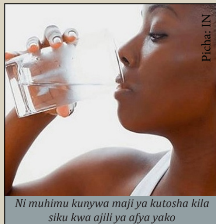
Ni muhimu kunywa maji ya kutosha kila siku kwa ajili ya afya yako