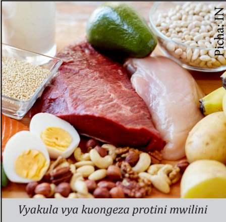
Vyakula vya kuongeza protini mwilini

Kumekuwa na maswali mengi kuhusu lishe hasa kutokana na janga la COVID-19. Maswali kama, je, tunapaswa kula nini kujenga na kudumisha mfumo wetu wa kinga ya mwili?