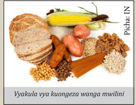
Vyakula vya kuongeza wanga mwilini