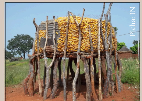
Kichanja cha kuhifadhi mahindi

Pamoja na hayo yote, hakikisha umeandaa eneo safi litakaloweza kubeba na kuhifadhi mazao yako kwa usalama bila kuharibiwa na wadudu au wanyama kama panya na hata bila kufikiwa na visumbufu vingine vina-vyoweza kupelekea uharibifu wa sumu kuvu kama maji ama unyevu wakati unaposubiria soko.