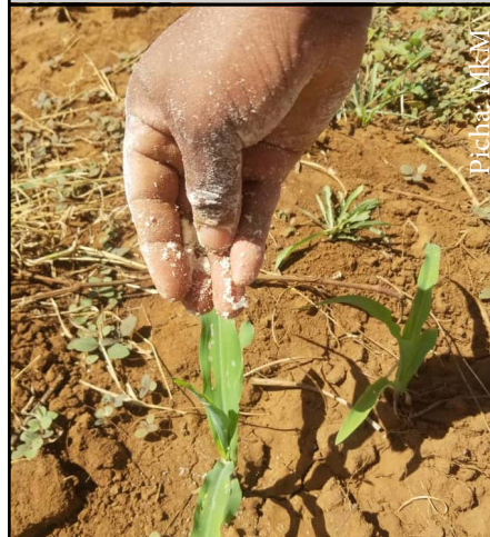
Namna sahihi ya kuweka dawa katika shina la mahindi

Dawa hii inapotumika humvuta mdudu aifuata hata zaidi ya futi moja toka aliko jificha wakati wa usiku. Mdu-du huyu huwa na tabia ya kutoka nje ya maficho wakati wa giza (usiku).