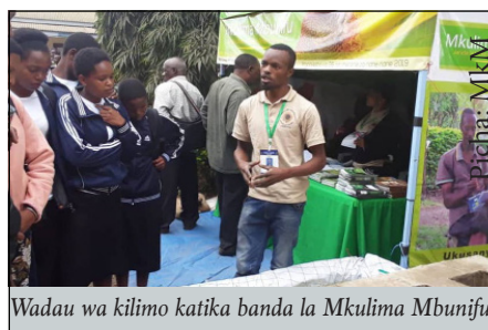
Wadau wa kilimo katika banda la Mkulima Mbunifu

Mwaka huu maonyesho hayo yatafanyika kitaifa mkoani Simiyu, Mkulima Mbunifu itashiriki kikamilifu hivyo usiache kututembelea katika banda letu. Katika maonyesho haya ya nane nane