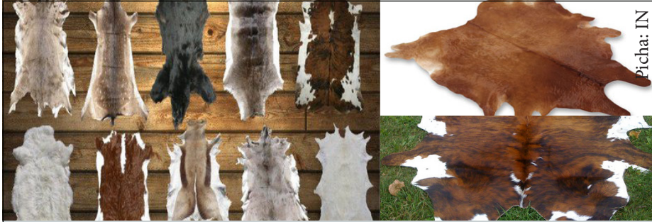
Ni muhimu kwa wafugaji kuhakikisha wanatumia malighafi zitokanazo na mifugo kutengeneza bidhaa bora

Ngozi hukaushwa ili kuzuia uharibifu unaotokana na kuoza kwa kuwa si ngozi zote zinazozalishwa hupelekwa kiwandani zikiwa mbichi ili kusindikwa.