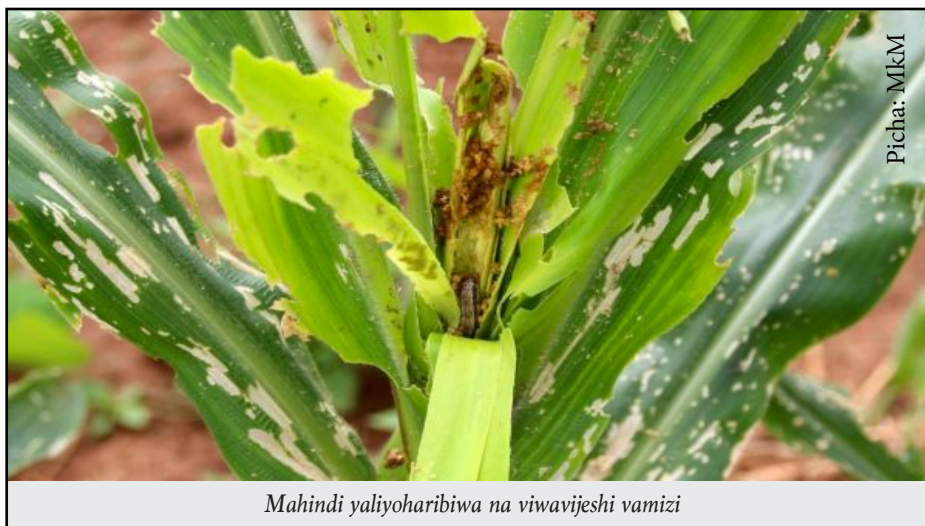
Mahindi yaliyoharibiwa na viwavijeshi vamizi

Mahindi ni zao muhimu na tegemezi kwa jamii nyingi barani Afrika. Nchini Tanzania zao hili hulimwa mikoa yote kwani ni zao mama kwa chakula.