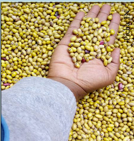
Maharagwe safi yaliyovunwa kwa wakati

Kukagua shamba: Kagua maharagwe shambani ili kujua kama yamekomaa. Kwa kawaida maharagwe hukomaa katika kipindi cha miezi mitatu hadi minne kutoka kupanda kutegemea aina na hali ya hewa. Wakati huo unyevu katika punje za maharagwe huwa ni kati ya asilimia 20 na 25. Kama kuna magugu kwa mfano mnana, ondoa magugu ili kurahisisha uvunaji.