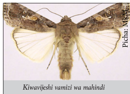
Kiwavijeshi vamizi wa mahindi

Mdudu huyu amekuwa tatizo kubwa katika Nchi za Kusini Mashariki ya Asia, na uangamizwaji wake umekuwa changamoto. Wakulima wengi wamepata hasara kutokana na uvamizi wa mdudu huyu, kwani si wote wanaweza kumudu gharama za kununua dawa ili kumuangamiza mdudu huyu.