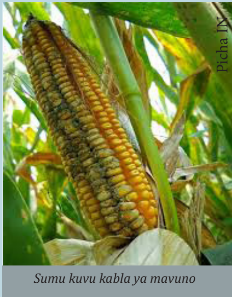
Sumu kuvu kabla ya mavuno

Upo uwezekano mkubwa kwa baadhi ya nafaka kuanza kuoza na kutengeneza ukungu huu ambao unambatana na sumu kuvu ndani yake ikiwa nafaka hiyo haijavunwa shambani mapema baada ya kukauka na baadaye mvua au unyevu mkubwa ukaingia shambani.