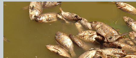
Uzalishaji na uhifadhi wa malisho ya mifugo 4&5