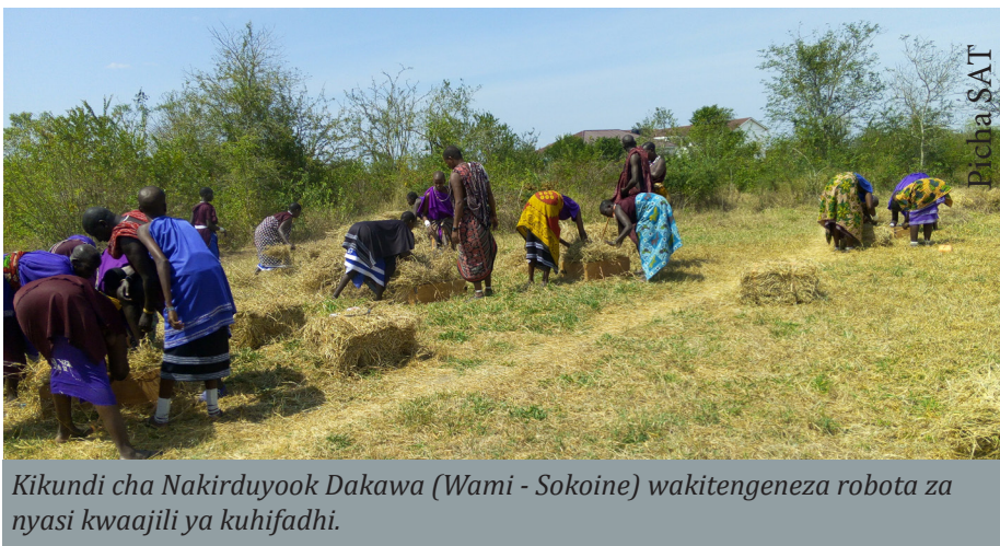
Kikundi cha Nakirduyook Dakawa (Wami - Sokoine) wakitengeneza robota za nyasi kwaajili ya kuhifadhi.

Kwanza: Hakikisha kwamba shamba lako lililooteshwa mara ya kwanza malisho huvunwa baada ya mbegu kukomaa