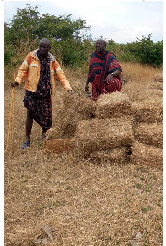
Mfugaji kutoka Lubungo (Mwajuni) akiendelea lake

Njia hii unashauriwa kuchanganya mbegu na mchanga au unga wa mbao ( Saw dust ). Hii itarahisisha uenezaji wa mbegu vizuri na kuzuia mlundikano wa mbegu sehemu moja. Baada ya kusambaza pia unaweza kuburuta tawi la mti/miba kusaidai usambazaji mzuri wa mbegu na hufukia mbegu isiweze sukumwa na upepo.