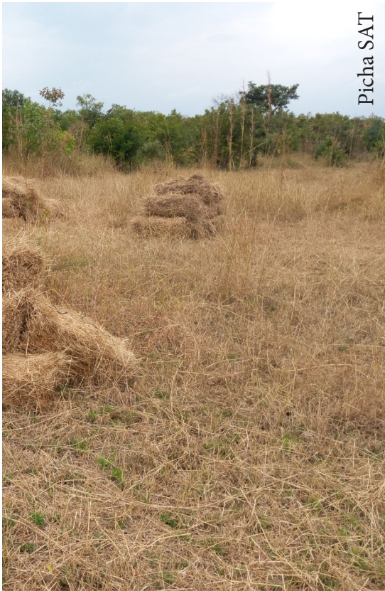
a na zoezi la uvunaji malisho, kwenye shamba

vizuri na kudondoka tayari kwa kuota msimu ujao.