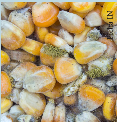
Sumu kuvu baada ya mavuno