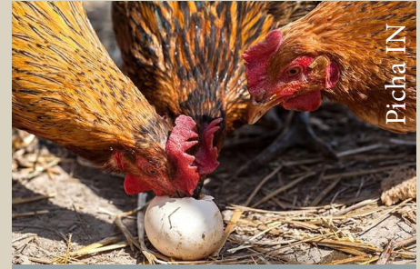
Kuku wakila mayai