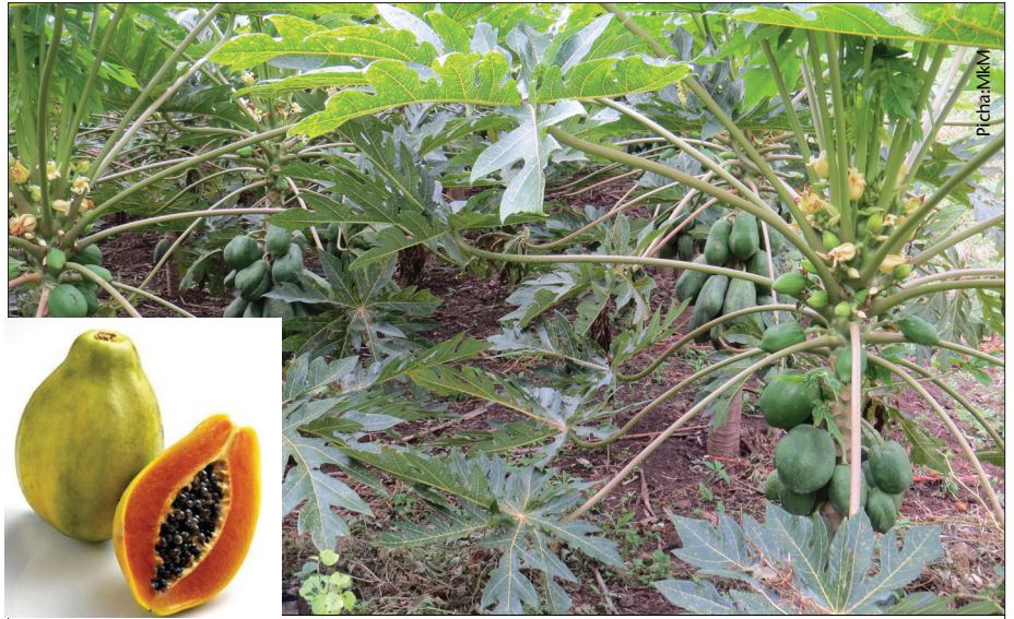
Ni muhimu kutekeleza kilimo bora cha mapapai kwa uzalishaji wenye tija

Mara baada ya kuvuna mapapai ni lazima kusafirisha katika hali yenye ubora kwa kutumia vyombo kama vile mikokoteni, magari pamoja na matela