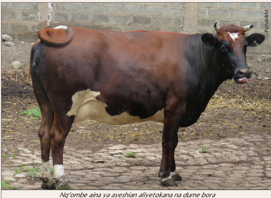
Ng'ombe aina ya ayesian aliyetokana na dume bora

Pamoja na yote hayo, ni muhimu kuzingatia lisho sahihi na yenye thamani kwani bila kufanya hivyo, uzalishaji pia huwa dhaifu na pia hupelekea kutokea kwa magonjwa ambayo huweza kuathiri mfumo mzima wa uzalishaji.