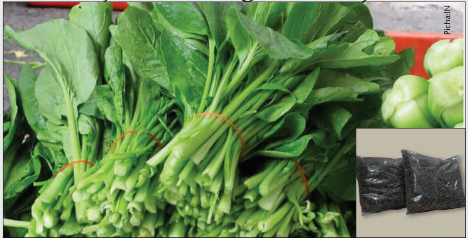
Ni vyema kukausha mboga za majani ili kuhakikisha upatikanaji wakati wa kiangazi

Utayarishaji wa mboga hizi hufanyika kwa kuziweka kwenye chujio kubwa safi au kitambaa safi cheupe na kuziweka kweye maji yanayochemka kwa muda usiozidi dakika mbili na