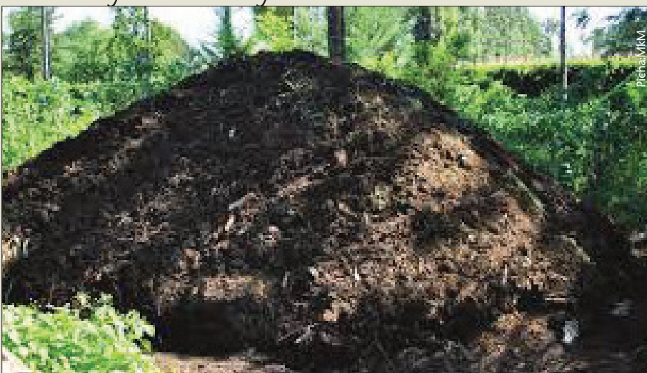
Samadi inayotokana na wanyama na mimea ni nzuri kwenye kilimo hai