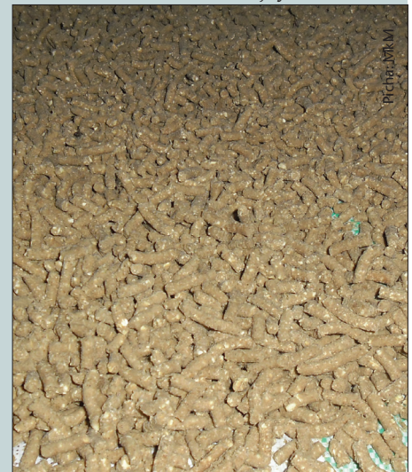
Chakula cha samaki

Udhibiti wa ubora wa vyakula hivi huusisha ukaguzi wakati wa matengenezo (processing) ya chakula ili kuhakikisha kuwa mahitaji yote muhimu