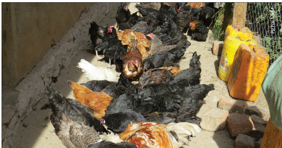
Kuku wa asili wakitunzwa vizuri huzalisha kwa wingi