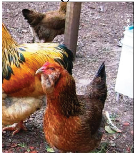
mfugaji atazingatia utoaji wa lishe

kutokana na lishe duni. Kutokana na hali hii kuku huchukua muda mrefu (miezi sita) kufikia uzito wa kuchinja (kilo 1 hadi 1.5). Na hali hii pia hufanya faida ya ufugaji wa kuku wa asili kuchukua muda mrefu kupatikana.