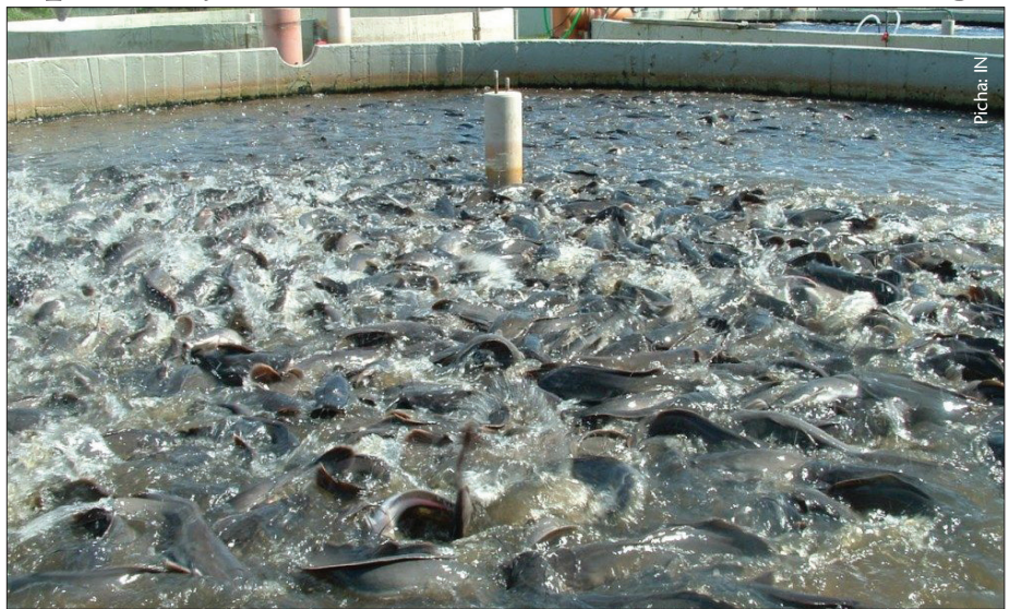
Moja ya jambo la msingi katika ufugaji samaki ni bwawa la kutosha kufugia