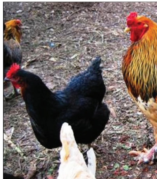
Ufugaji wa kuku asili ni rahisi ikiwa