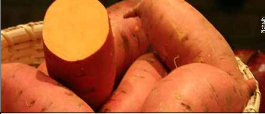
Hifadhi viazi vitamu kwa matumizi ya baadae

Viazi vitamu ni moja kati ya mazao ya mizizi yanayolimwa kwa ajili ya chakula cha binadamu na mifugo. Pia ni kwa ajili ya malighafi viwandani na kuongeza kipato kwa mkulima.