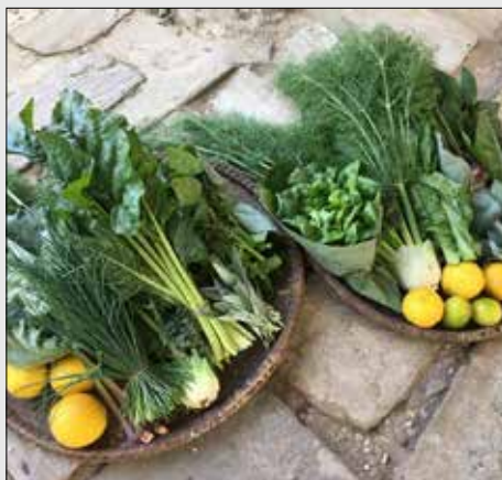
Nembo inayotumika kwa bidhaa za kilimo hai