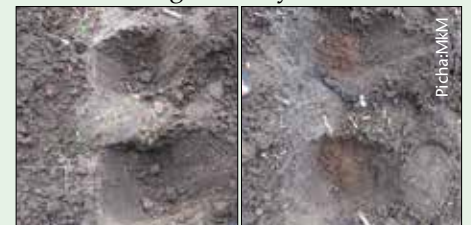
Mashimo ya zai yakiwa tayari kwa ajili ya kuoteshea mahindi

Mbolea ya asili ndio jibu la mafanikio yako, kwani ni rahisi kutengeneza mahitaji yanapatikana katika mazingira tunayoishi.