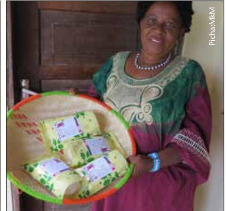
Unga bora wa mchicha nafaka unatokana na mchicha uliozalishwa kwa ufanisi