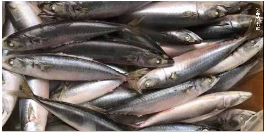
Katika mlo wa familia samaki kama mboga isikosekane mara kwa mara

Kina mama wajawazito wamekuwa wakipewa ushauri kutumia kitoweo hicho wawapo wajawazito na kuepuka nyama nyekundu ambayo hata hivyo ni muhimu kwa mama mjamzito kutumia ili kuongeza damu haraka.