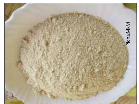
Unga uliotokana na mchicha nafaka

Mkulima Mbunifu ni jarida huru kwa jamii ya wakulima Afrika Mashariki. Jarida hili linaeleza habari za kilimo hai na kuruhusu majadiliano katika nyanja zote za kilimo endelevu. Jarida hili linatayarishwa kila mwezi na Mkulima Mbunifu , Arusha, ni moja wapo ya mradi