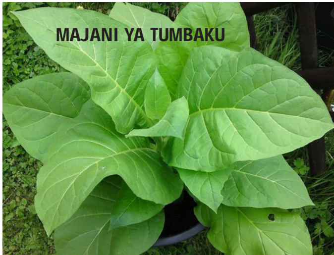
MAJANI YA TUMBAKU

Inashauriwa kuvuna mazao siku 4-5 baada ya kunyunyiza aina hii ya dawa.