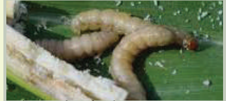
Lishe Bora kwa familia 6