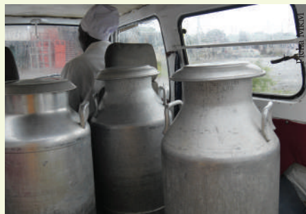
Vyombo sahihi vya kuhifadhi na kusafirisha maziwa