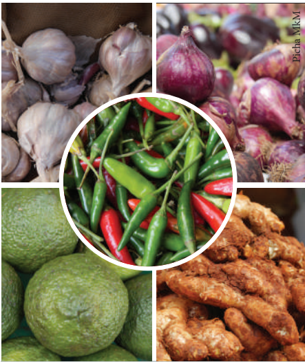
Viungo muhimu katika mwili wa binadamu

Pamoja na viungo kutumika kuongeza ladha katika vyakula, pia vina manufaa katika mwili wa binadamu.