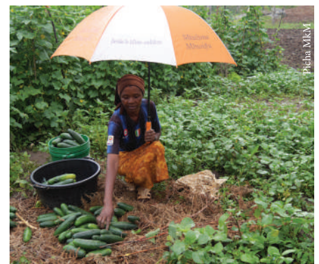
Mkulima wilayani Lushoto akusanya mazao ili kupeleka sokoni

Fuatilia taarifa za habari kwani serikali kupitia wizara ya afya inatoa taarifa mara kwa mara juu ya ugonjwa huu wa COVID-19, hivyo ni vyema kujua kinachoendelea na kujiweka sambamba na yanayoendelea.