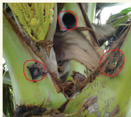
Mashimo katika mnazi yakiashiria uwepo wa mdudu faru