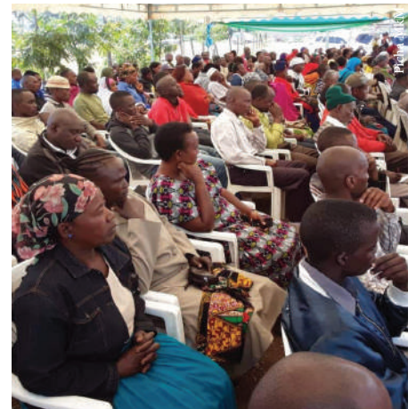
Wanakikundi wa KIBIU wakiwa katika kikao

Hata hivyo, kikundi hiki kimefanikiwa kwani wamepata soko la kuuza mazao nje ya nchi kwa njia ya mkataba. Utaratibu, kanuni na sheria za kikundi hiki ikiwamo uongozi mzuri umesaidia mafanikio ya mkulima mmoja mmoja.