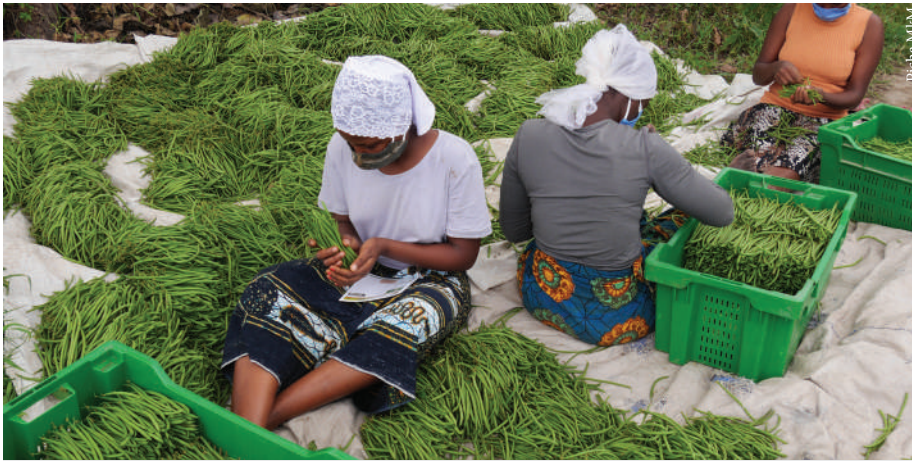
Mazao ya kilimo biashara, yazingatie uzalishaji bora na wenye tija

Kilimo kitabaki kuwa msingi wa ukauji wa uchumi kupunguza umaskini na kudumisha mazingira iwapo kitafayika kwa utaratibu. Hata hivyo ni muhimu mkulima kuzingatia kilimo biashara ili kukuza kipato.