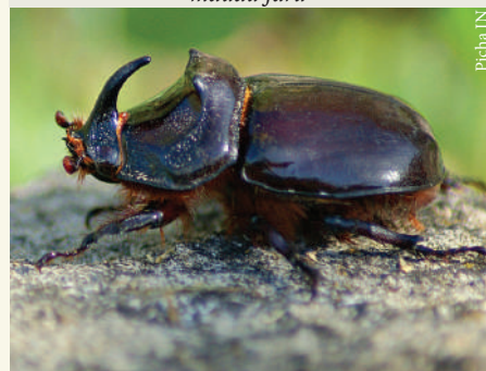
Mdudu faru wa minazi ( Rhinoceros beetle )