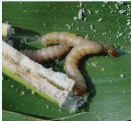
Kipekecha shina ( Busseola fusca )

Vipekecha shina wa mahindi ni wadudu waharibifu wa mahindi, mtama na mazao mengine katika nchi nyingi za Afrika. Viwavi wa nondo, huchimba na kuingia ndani ya shina la mahindi, wakila tishu za ndani na kusababisha mmea kunyauka na hatimaye kufa.