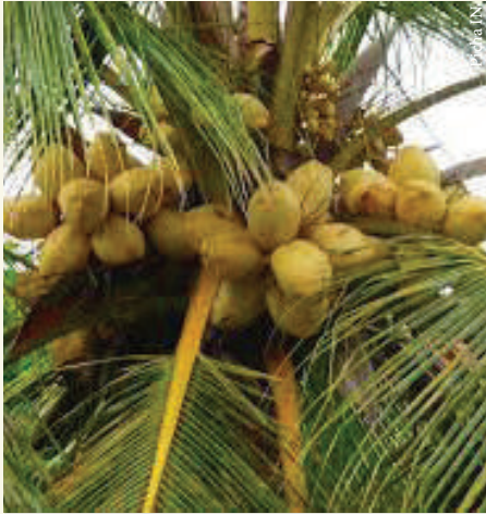
Hakikisha unazingatia kanuni bora za uzalishaji wa minazi

Minazi ni zao la biashara nchini Tanzania ambapo hulimwa na kustawi zaidi ukanda wa pwani ya Tanzania. Mikoa kama Lindi, Mtwara, Pwani, Dar es salaam, Tanga na visiwa vya Unguja na Pemba, pia kwa uchache Minazi hulimwa kwenye mikoa ya Mbeya, Kigoma na Tabora.