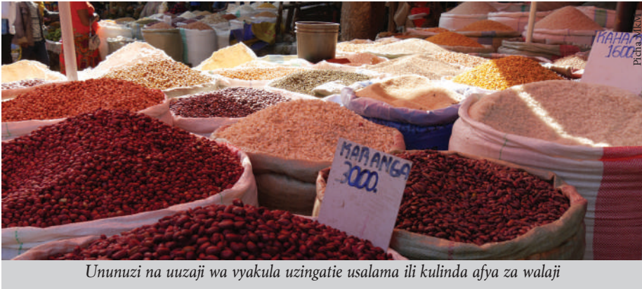
Ununuzi na uuzaji wa vyakula uzingatie usalama ili kulinda afya za walaji

Janga la Covid-19 linachangia changamoto ya usalama wa chakula na lishe bora duniani. Kuwepo na mfumo endelevu wa chakula na mahali panapoweza kuhakikisha usambazaji wa chakula bora katika nyakati kama hizi, ni fursa ambazo miji mi-chache ulimwenguni zinafurahia.