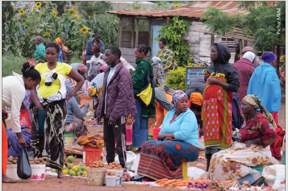
Wakulima hawana budi kufanya shughuli zao kwa mrengo wa kilimo biashara

Mkulima ambaye yuko kwenye kilimo mseto atakuwa anauza bidhaa mbalimbali kutokana na shughuli za kilimo, ufugaji, uvuvi na mazao ya misitu na kipato chake kinakuwa kikubwa kama