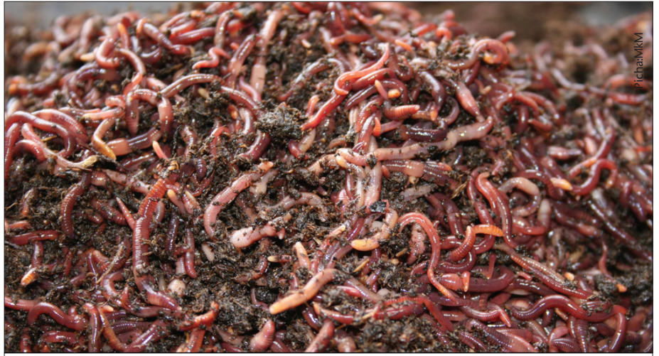
Minyoo wekundu ni moja ya chanzo cha lishe kwa kuku, bata na samaki