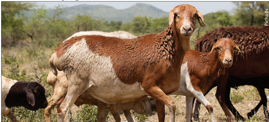
Wanyama wote wanastahili matunzo bora ili kulinda afya zao

Katika toleo lijalo, tutaangalia baadhi ya magonjwa ya mifugo na njia za asili zinazoweza kutumika kutibu magonjwa hayo na zikaleta ufanisi mkubwa.