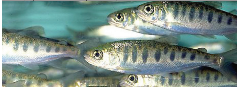
Samaki wa maji baridi wanaweza pia kufugwa sehemu ya maji chumvi

unaweza kufanyika kati ya mwezi wa 2 hadi wa 6. Hii ni kwa sababu wakati huo maji huchanganyikana kutokana na uwepo wa mvua nyingi.