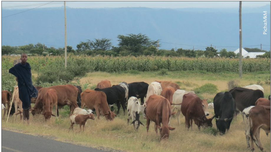
Ni muhimu mifugo kupata fursa ya kujilisha na kufanya mazoezi

Mwili wa mnyama mweye afya nzuri una uwezo mkubwa wa kukibadili chakula anachokula, kutoa mazao ya kutosha kama vile maziwa na anaonekana mwenye nguvu na kwa wale