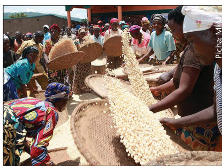
Ni muhimu wakulima wakajipanga na kuchangamkia soko la mazao yao

Mkurugenzi wa Chakula Duniani alisema kuna fursa nyingi kwa Tanzania