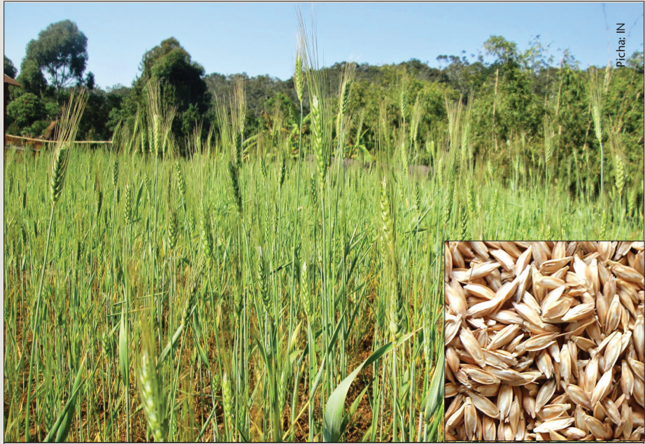
Zao la ngano ni moja ya mazao yenye faida kubwa endapo mkulima atazingatia matunzo

Katika njia hii mashina hukatwa kwa kutumia kisu au siko. Kwa kutumia