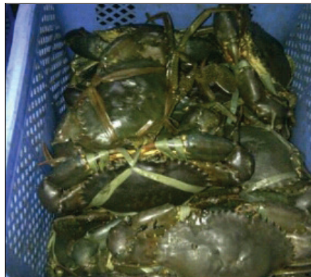
Kaa ni moja ya jamii ya samaki wanaoweza kumuingizia mfugaji pato la uhakika

Katika aina hii ya ufugaji, mfugaji hupaswa kutengeneza kizimba kikubwa na kukigawanya katika vyumba vidogo vidigo ambapo ndipo watakapoishi kaa.