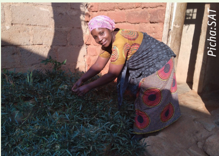
Bi. Roza akiendelea na kazi katika bustani ya nyumbani

Hata hivyo aliamua kujiunga na kikundi cha wakulima cha Wilunze (mwaka 2020), ambacho kiko chini ya mradi wa "Wanawake wa Dodoma katika Kilimo na Biashara" (DWABI) na kuweza kupata mafanikio makubwa katika kilimo hai.