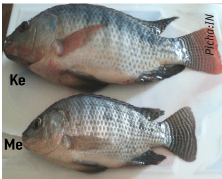
Jike na dume