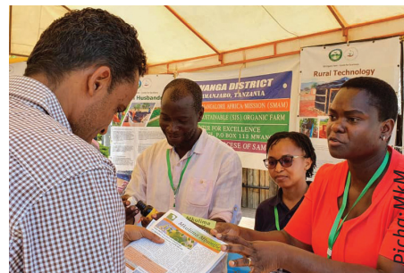
Mhariri wa MkM akimweleza jambo Naibu Waziri wa Kilimo Mh. Hussein Bashe

Mkulima Mbunifu kama mdau wa kilimo hai nchini, imeweza kuwa mmoja wa washiriki katika kongamano hilo na imefanikiwa kuendelea kushirikisha elimu ya kilimo hai kwa wadau mbalimbali kwa njia ya majarida na vitabu vya kilimo na ufugaji.