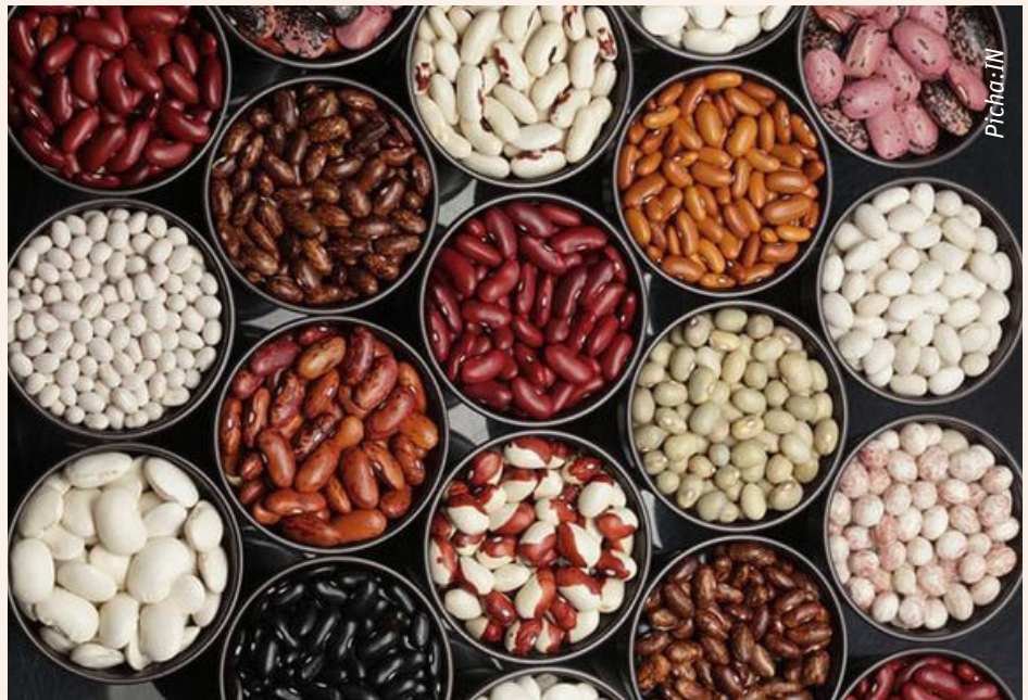
Aina mbalimbali za maharagwe ambayo mkulima anaweza kuzalisha