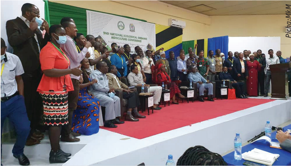
Wadau wa kilimo hai ndani na nje ya Tanzania wakiwa katika picha ya pamoja

Kilimo hai ni moja ya agenda zenye msukumo mkubwa sana duniani hivi sasa. Mnamo tarehe 21 – 22 October 2021, lilifanyika kongamano la kilimo hai nchini Tanzania lililobeba ujumbe “Kuharakisha utekelezaji wa kilimo hai ili kuhakikisha uendelevu wa mfumo wa chakula’.