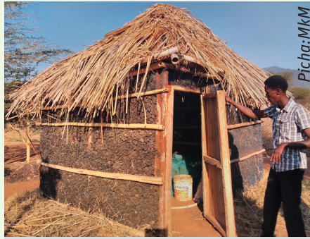
Namna jokofu la asili linavyoonekana