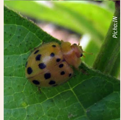
Wadudu waharibifu wa maharagwe wanaweza kushambulia na kuteketeza mimea yote ya maharagwe