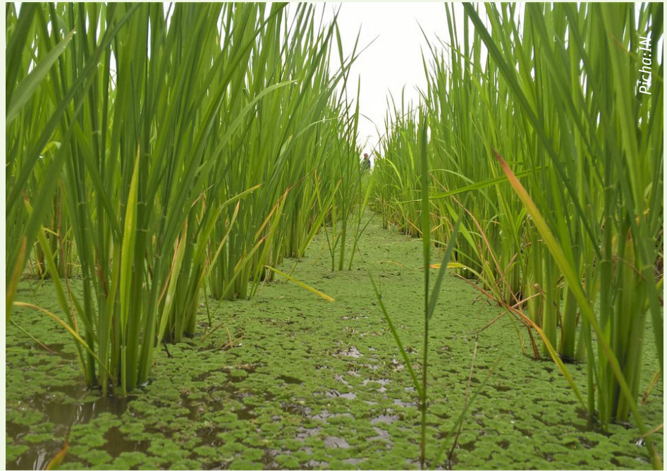
Mmea wa azola unavyotumika katika kilimo kurutubisha mimea

kivuli ikishakauka isage ili kupata unga kisha weka kwenye mashina ya mimea au kama ni nyingi mwaga kwenye mtaro shambani ijichanganye na udongo.