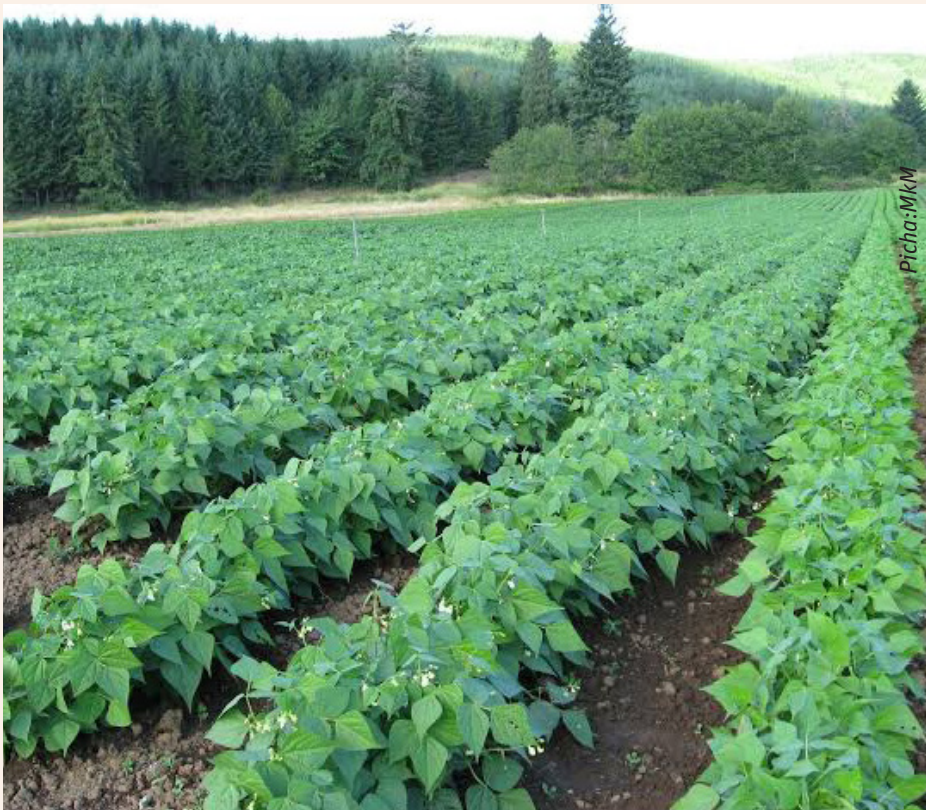
Shamba la zao la maharagwe linatakiwa liwe safi wakati wote ili kuondokana na magugu, magonjwa na wadudu

zao hili ni vyema kufahamu hali ya eneo husika kama;