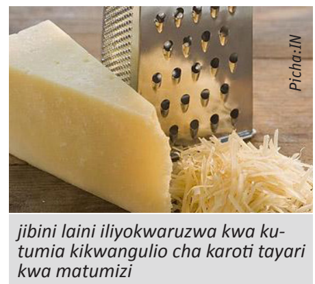
Jibini laini iliyokwaruzwa kwa kutumia kikwangulio cha karoti tayari kwa matumizi