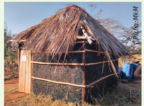
Jokofu asilia kwa ajili ya kuhifadhi mazao ya mboga mboga na matunda mara baada ya kuvuna