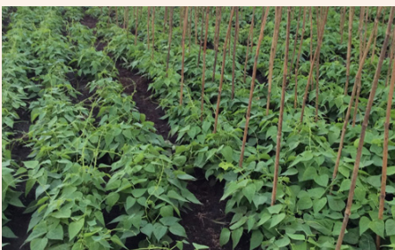
Unaweza kuweka miti katika shamba lako ili kuzuia mimea kuanguka chini na kupata magonjwa ya ukungu ama kuoza

Mbinu za kudhibiti magonjwa na wadudu waharibifu wa maharage