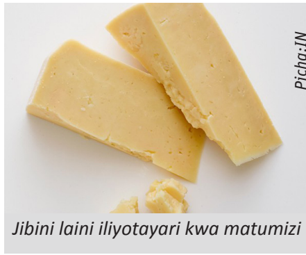
Jibini laini iliyotayari kwa matumizi