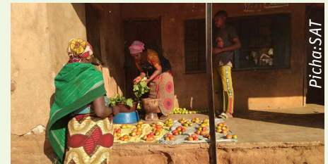
Bi. Roza akiwa katika eneo lake la nyumbani anakofanyia biashara ndogo ya uzaji wa mboga zilizoza-lishwa kwa misingi ya kilimo hai

Biashara mojawapo ni mgahawa pamoja na kibanda cha kuuza mboga anazozalisha katika bustani yake ya jikoni na vile vile anayozalisha pamoja na wakulima wengine katika kikundi chake.