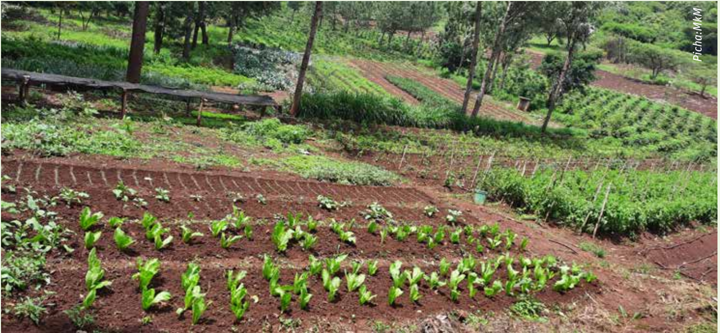
Jumuisha miti katika shamba lako kwa manufaa zaidi kwenye uzalishaji kiuchumi na kimazingira

Unaweza kutunza mazingira huku ukizalisha mazao mengi na kupata faida kubwa zaidi kutoka katika eneo dogo.