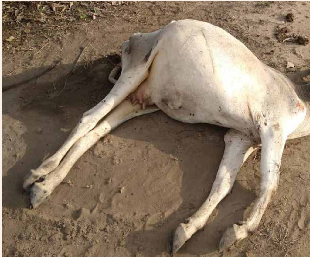
Mifugo hupoteza uhai kutokana na kukosa chakula hasa katika msimu wa kiangazi/ukame hivyo ni mu

Hali hii imesababisha wafugaji kuhama ambapo jambo hili limeinua u migogoro kwani wafugaji wamejikuta wakiingia kulisha mifugo maeneo yasirohushiwa.