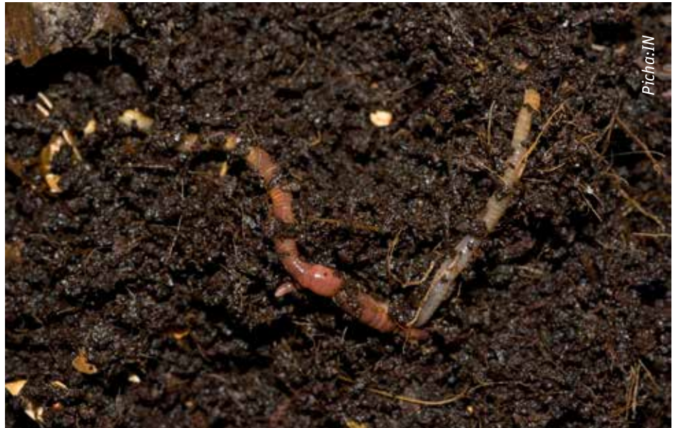
Udongo wenye rutuba ni rahisi kufahamu hasa kwa kuwepo kwa wadudu rafiki warutubishaji

mazao kutawanyika vizuri na kufikia rutuba na maji chini kwenye udongo.