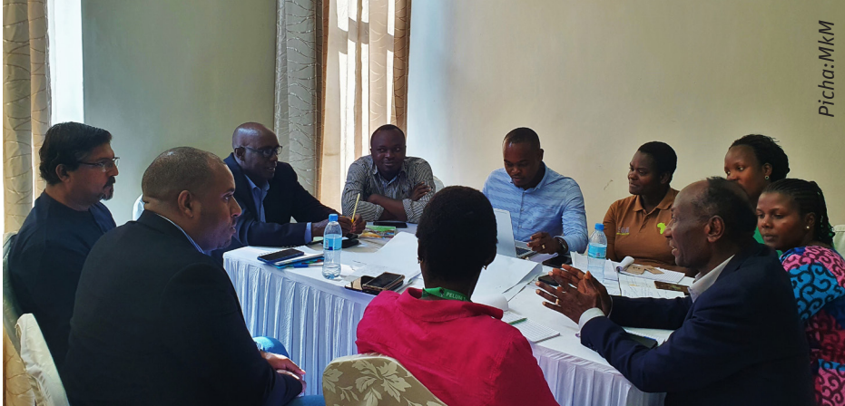
Wadau mbalimbali wa kilimo wakijadili namna ya kupambana na jangwa

Iles de Paix, Ubalozi wa Ufaransa nchini Tanzania na PELUM – Tanzania waliandaa warsha ya kitaifa iliyokua na mada kuhusu: Suluhu za Kilimo ili kukabiliana na kuenea kwa jangwa na kuhamasisha mifumo endelevu ya chakula. Warsha hii ilifanyika katika ukumbi wa hotel ya Corridor Spring Arusha tarehe 9 Machi 2022.