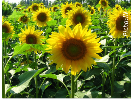
Alizeti ikitunzwa vizuri huweza kuzalisha maua mengi yenye afya hivyo kupelekea uzalishaji mkubwa wa mafuta

sentimita 60 kwa mbegu mbilimbili inategemea hali ya mbegu lakini pia nafasi katika ya mstari mmoja hadi mwingine ni sentimita 60 hadi 75.