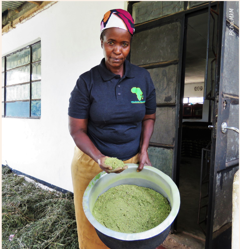
Unga wa mlonge mara baada ya kutwanga, tayari kwa kuweka kwenye mimea moja kwa moja au kuchanganya na mkojo wa mifugo kupata busta