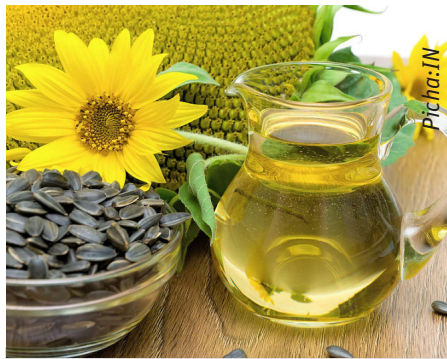
Mafuta ya alizeti yakizalishwa kwa kuzingatia kanuni bora za kilimo, hupelekea kupatikana kwa mafuta bora na salama

Mkulima anashauriwa kuzingatia vipimo yaani sentimita 45 shimo hadi shimo kwa mbegu moja moja na