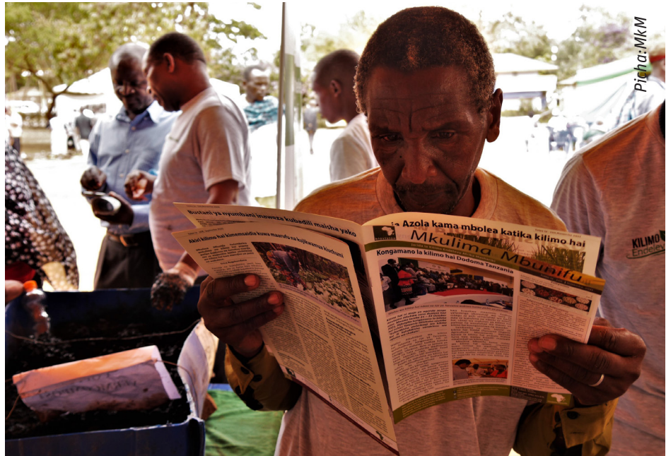
Mdau wa jarida la Mkulima Mbunifu akisoma kwa umakini taarifa muhimu za kilimo zilizo-chapishwa kwenye jarida hilo kwenye maonyesho ye mbegu na vyakula vya asili wilaya ya Karatu

Jibu toka Mkulima Mbunifu; Ulishaji wa nguruwe huongezeka kulingana na ukuaji wake (umri).