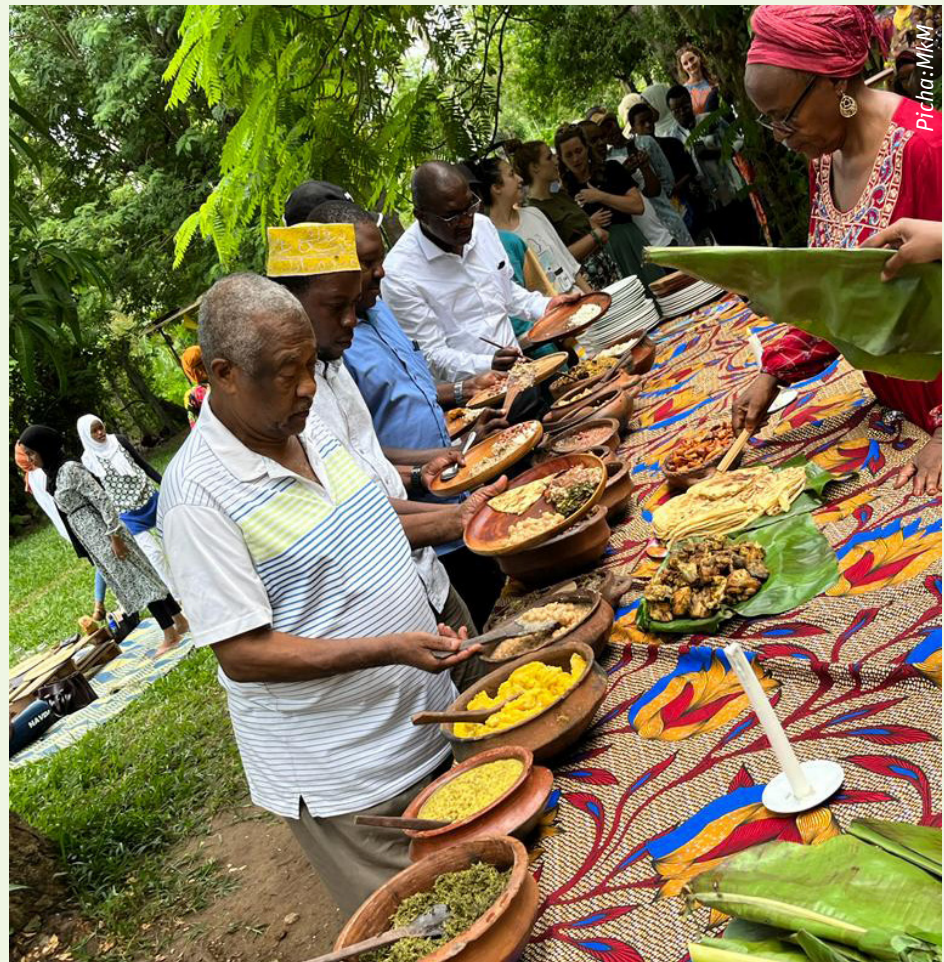
Namna ambavyo wanajamii wamefurika kula vyakula vya asili vilivyozalishwa kwa misingi ya kilimo hai katika shamba la kilimo hai Zanzibar