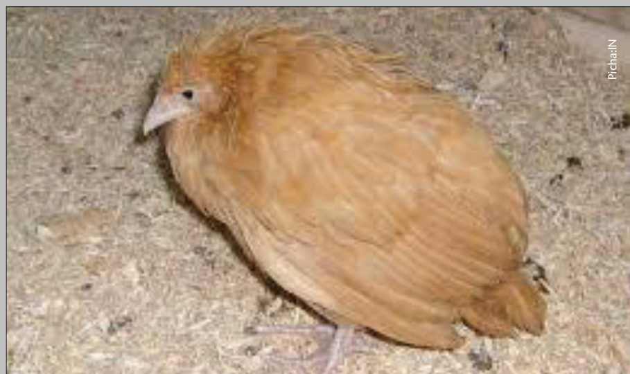
Kifaranga mwenye ugonjwa wa mdondo