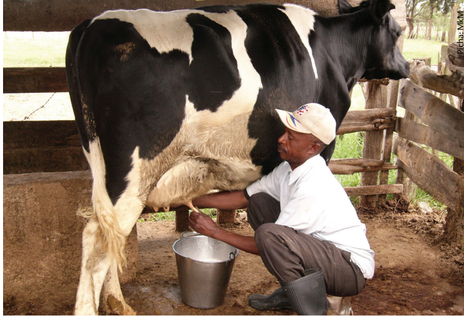
Wakati wa kukamua hakikisha eneo la kukamlia lipo katika hali ya usafi

Maziwa yanaweza kuwa machafu kutokana na mambo mbalimbali kama vile ng'ombe wagonjwa, kinyesi cha mifugo, vyombo au mashine ya kukamulia isiyosafishwa kwa ufasaha na mambo kadha wa kadha.