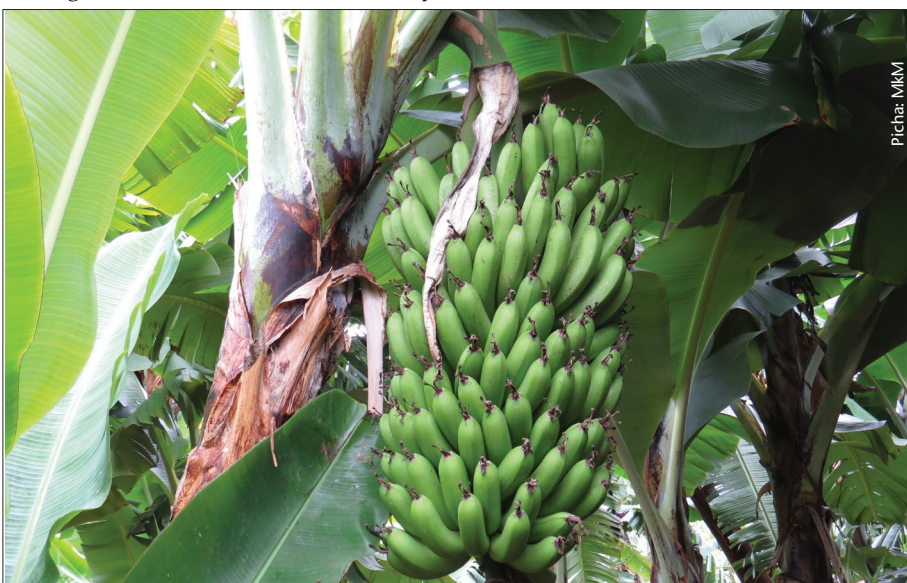
Mgomba uliotunzwa vizuri uzalishaji wake huwa na tija

Mawe huzipiga ndizi na kusababisha madoamadoa meusi. Ndizi za namna hii zikipikwa hazina ladha nzuri.