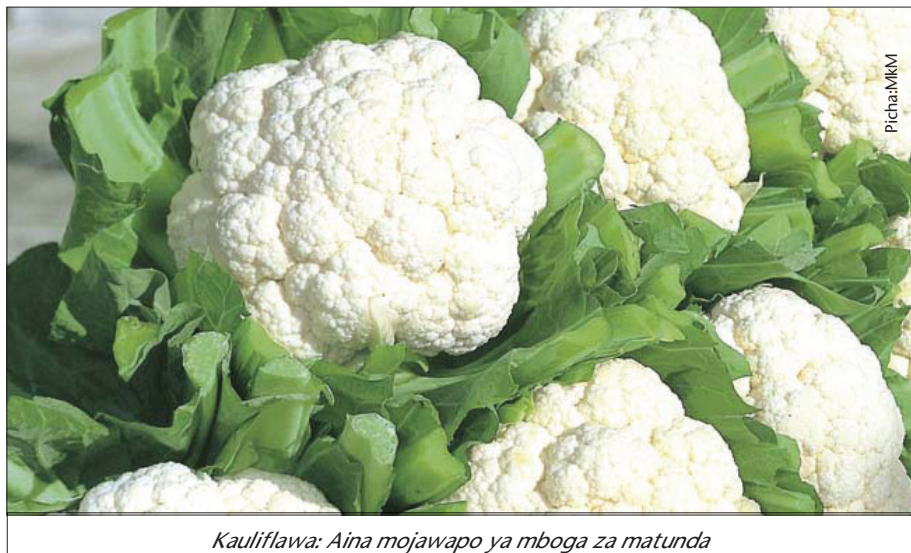
Kauliflawa: Aina mojawapo ya mboga za matunda

Unapokosa kula mboga, maradhi mbalimbali huweza kushambulia mwili wako. Maradhi kama vile unyafuzi, nyogea, vidonda mdomoni na kwenye fizi, kupofuka macho, kukosa damu mwilini, matege na mifupa hafifu pamoja na tezi.