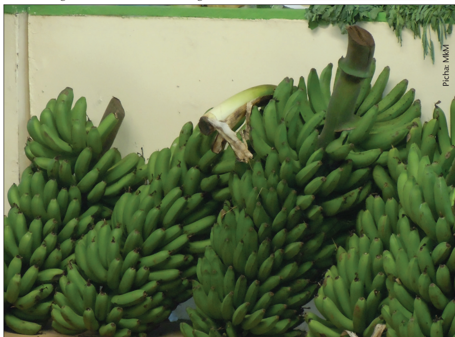
Migomba ikitunzwa vizuri mkulima ana uhakika wa mavuno bora

Nafasi ya shimo hadi shimo iwe ni mita 3.