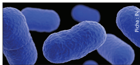
Bakteria aina ya Listeria

rasmi Machi 7 mwaka huu hadi pale itakapothibitika kuwa bidhaa hizo ni salama.