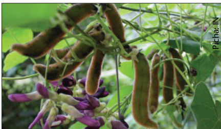
Mmea wa mucuna