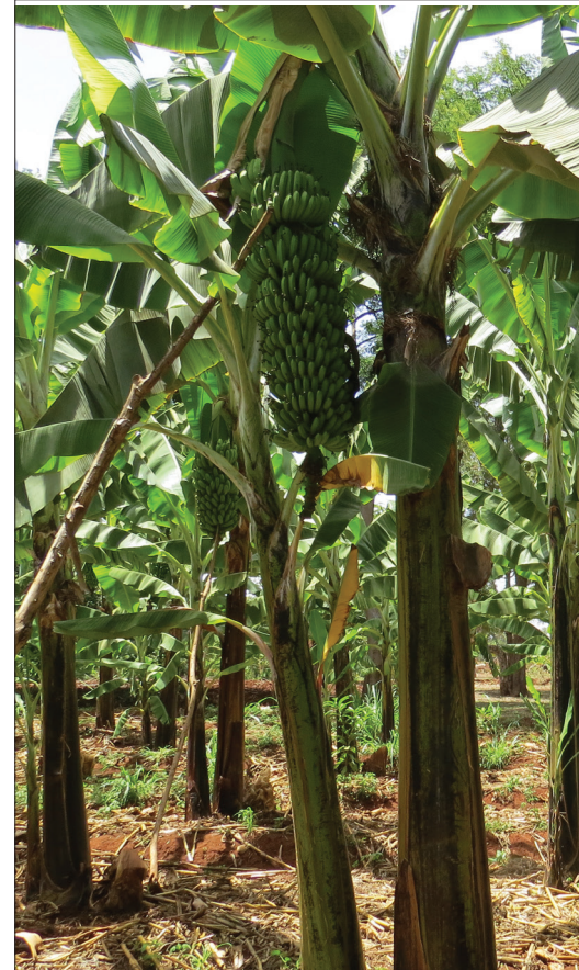
Shamba la migomba linahitaji