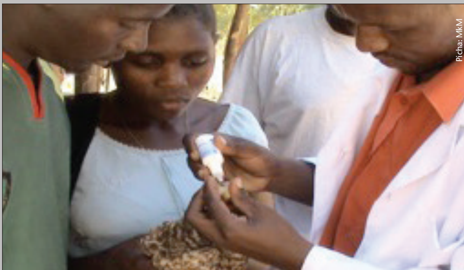
Hakikisha wakati wa kuchanja kuku, tone moja tu ndilo lonaloingia kwenye jicho

chanjo iviringishwe kutambaa cha pamba kilichowezeshwa maji baridi na huku isafirishwe kwenye kijikapu kidogo kilichofunikwa chenye matundu makubwa yapitishayo hewa pande zote.