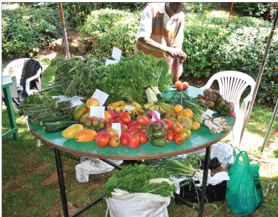
Mboga za aina mbalimbali zinahitajika katika lishe kwa ajili ya afya zetu