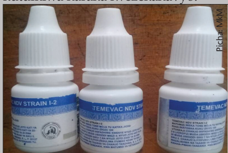
Chanjo kwa ajili ya ugonjwa wa mdondo

Chanjo ndani ya jokofu kamwe isiwekwe kwenye sehemu ya kugandishia barafu (freezer), Kama hakuna jokofu, chanjo hii itunzwe kivulini, kwenye hali ya ubaridi na kutumiwa haraka iwezekanavyo.