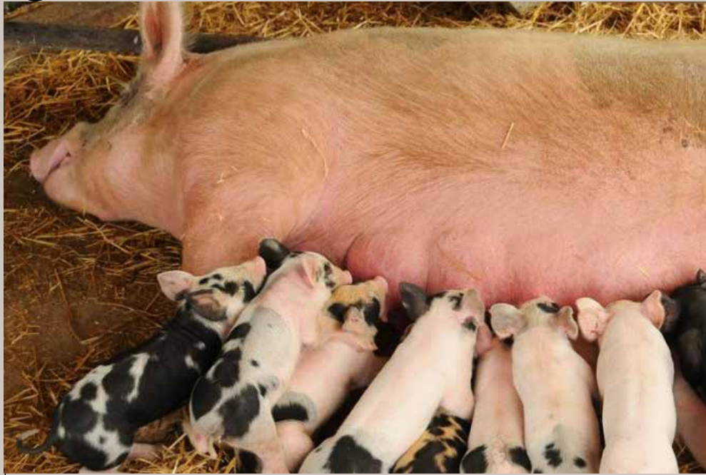
Nguruwe aliyetunzwa vizuri na mwenye afya bora huzaa mpaka watoto 12 kwa uzao mmoja.

Nguruwe dume anaweza kutumika kwa kupandajike akiwa na umri wa miezi minane hadi tisa. Kwa umri huu anaruhusiwa kupanda jike mmoja kwa juma. Afikiapo miezi 10 anaruhusiwa kupanda majike mawili