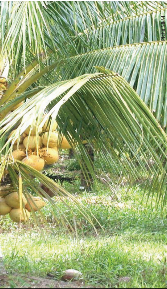
Ma minazi ili kupata mavuno bora

mfululizo kwa kutumia upawa ili kuzuia mashata kuganda kwenye chombo.