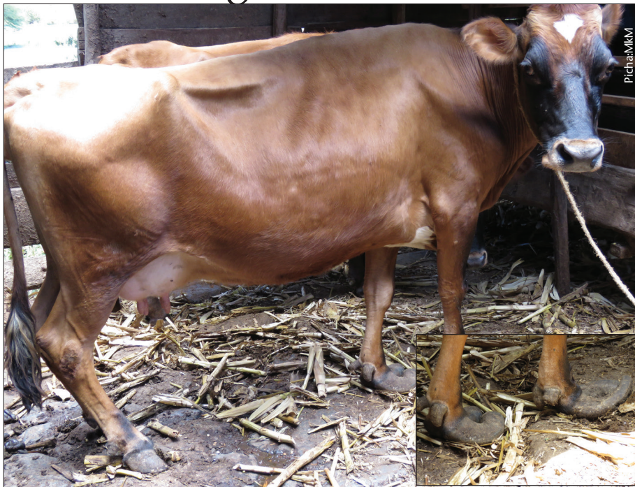
Ng'ombe asipokatwa kwato huteseka na kushindwa kuhimili uzito wa mwili

Pia mimba inapokuwa ng'ombe huwa kwenye maumivu makali