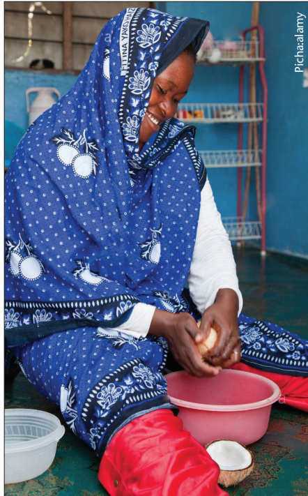
Nazi hutumika kama kiungo muhimu kwenye mapishi