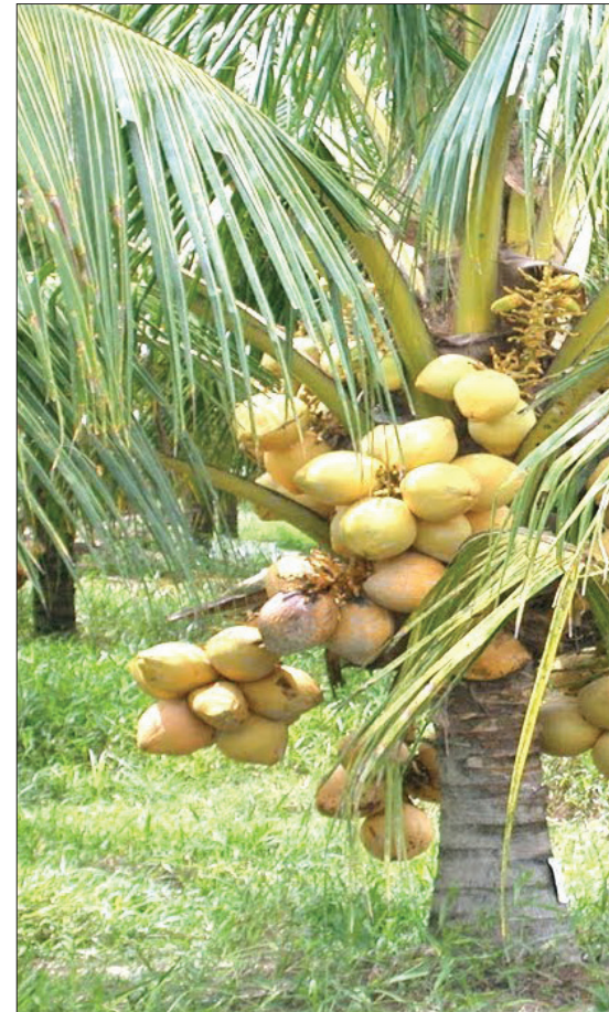
Ni muhimu kutunza shamba la m