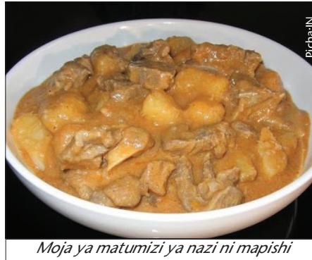
Moja ya matumizi ya nazi ni mapishi

Tui hutumika katika mapishi mbalimbali kwa ajili ya kuongeza ladha na kuboresha virutubishi.