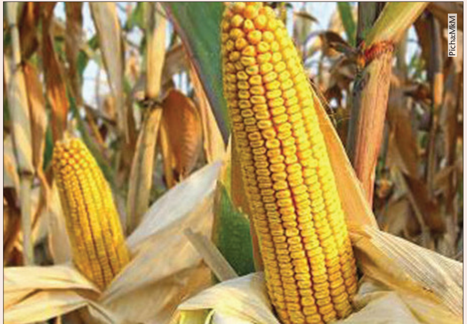
Sumu ya kuvu inaweza kuathiri mazao tangu yakiwa shambani

Ili kuepuka hili kutokea, mahindi yanapaswa kuvunwa punde yanapokauka shambani na kuanikwa