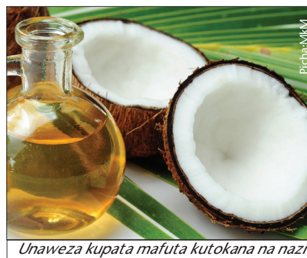
Unaweza kupata mafuta kutokana na nazi

Kuna njia mbili za kukamua nazi ili kupata mafuta ya nazi. Njia hizo ni: