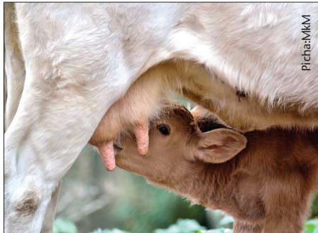
Mfumo wa kisasa humpa mfugaji fursa ya kukamua baadhi ya chuchu

Huu ni mfumo uliozoeleka zaidi ambapo mfugaji anakamua baadhi ya chuchu na kuacha nyingine kwa ajili ya ndama kupata maziwa.