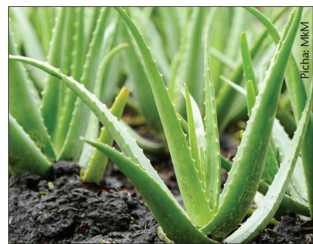
Alovera pia hutumika kutibu magonjwa ya ng'ombe kama vile kuvimbiwa

Ukizingatia haya yote katika ufugaji ni dhahiri afya ya mnyama itakuwa nzuri zaidi, lakini pia magonjwa hayataandama mifugo na ikitokea basi hakikisha unatibu kwanza kwa tiba za asili.