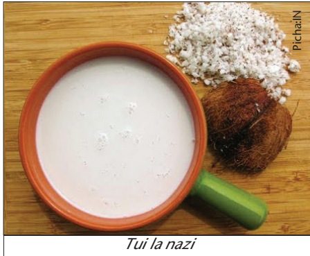
Tui la nazi

Nazi husindikwa ili kupata bidhaa mbalimbali kama vile tui, mafuta, nazi kavu au achari(jamu).