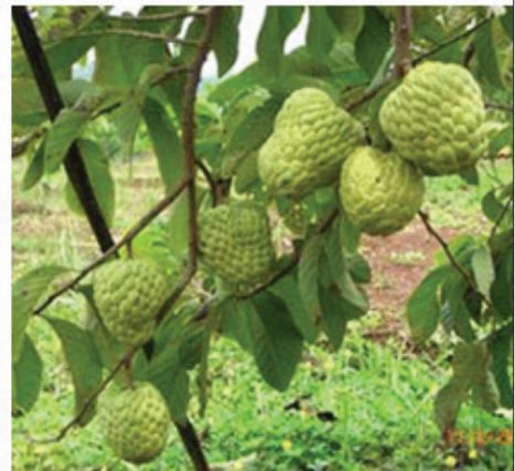
Baadhi ya mimea na miti inayoweza kutumika kama dawa za asili kutibu ng'ombe

kuwa mkaa na kusagwa kisha kuchanganywa kiganja kimoja na lita 1 ya maji hutibu ugonjwa wa kuhara.