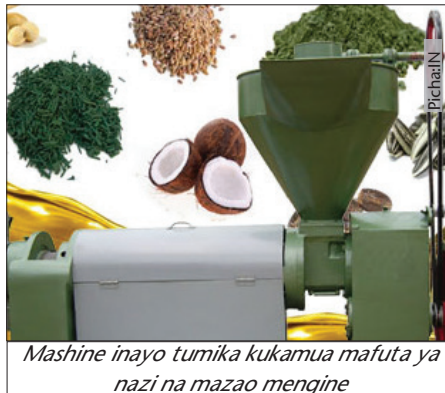
Mashine inayo tumika kukamua mafuta ya nazi na mazao mengine

Pia, sufuria ya kukingia mafuta yatokayo kwenye mashine, mkeka wa kuanikia au karatasi la nailoni, chujio, panga au kipande cha chuma cha kuvunja nazi, chupa au vyombo vya