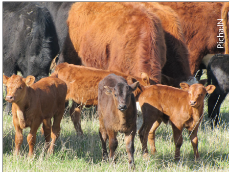
Mfumo wa asili huruhusu ndama kutembea na mama na kunyonya wakati wote

Huu ni mfumo ambao humwezesha ndama kutembea na mama muda