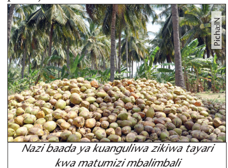
Nazi baada ya kuanguliwa zikiwa tayari kwa matumizi mbalimbali

Pia, chujio kwa ajili ya kuchujia, mpare wa kumiminia mafuta, panga au kipande cha chuma cha kuvunja nazi pamoja na lebo na lakiri.